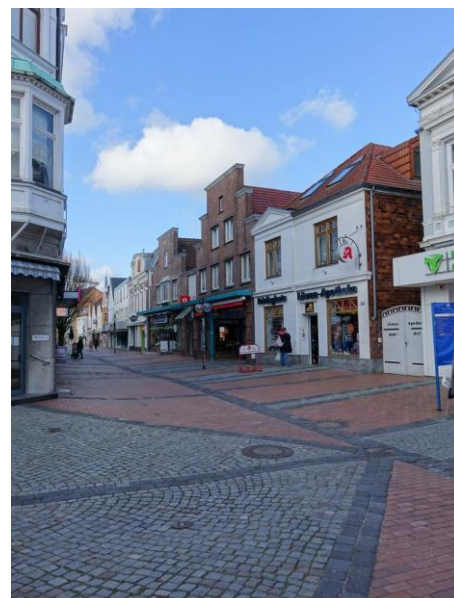
Leere Straßen in Corona-Zeiten