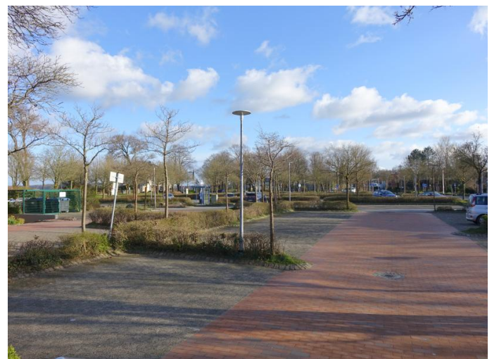
Leerer Parkplatz Exer